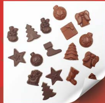
Frites de Noël