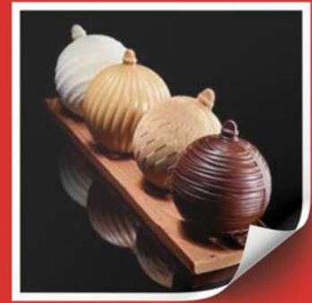
Boules de Noël