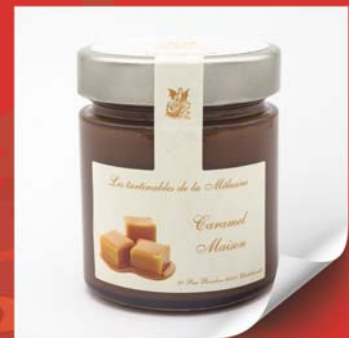
Les tartinables de La Méline 225g Chocolat - Praliné - Caramel