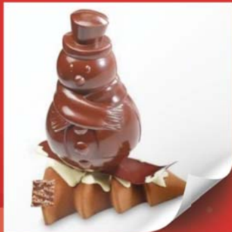
Bonhomme de neige 14cm