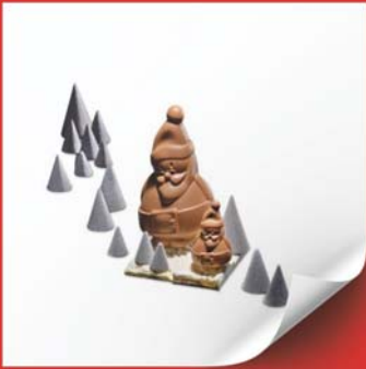
Père Noël 7 - 14cm