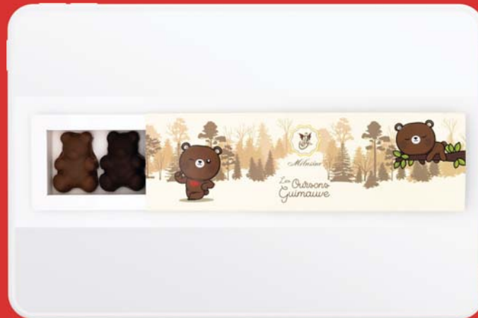
Les oursons guimauve