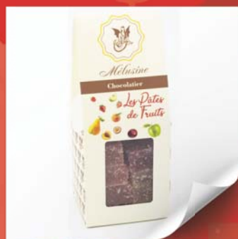
Les pâtes de fruits