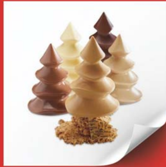
Sapin 7 - 14cm